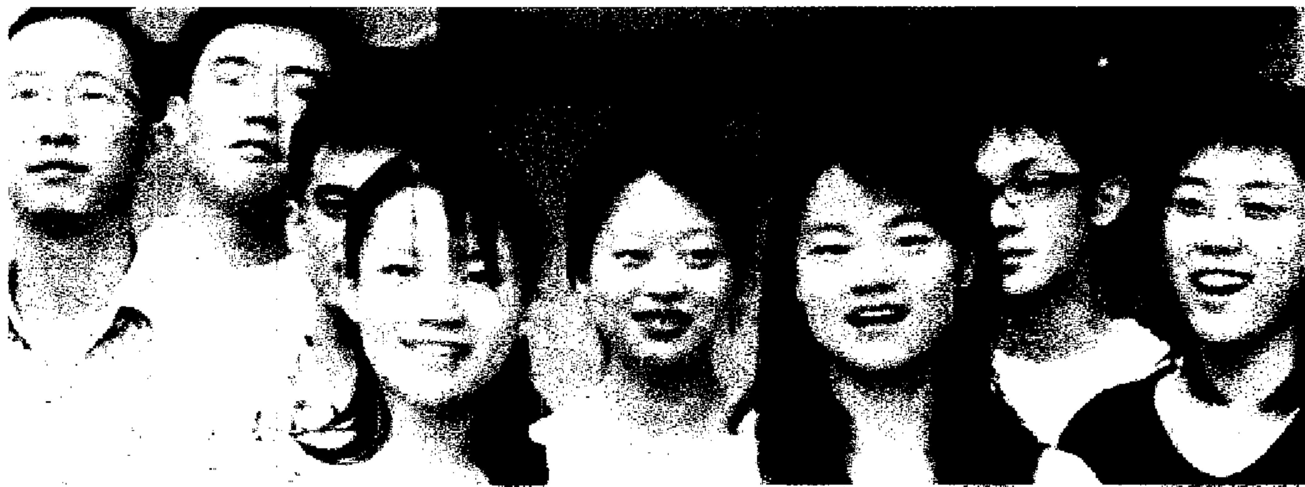
I ragazzi di Bologna. Foto di gruppo degli studenti cinesi residenti al Collegio di Bologna

Anche la crescita degli accordi e delle borse di studio ha stimolato l'interesse. Oltre alle 300 mensilità erogate dal governo italiano, sono state quasi 200 quelle offerte da atenei e altri istituti. Vengono, tra gli altri, dalle università per stranieri di Perugia e Siena, dall'università di Trento, dalla Cattolica di Milano e dalla Mib School of management di Trieste. Sono 140 le matricole dell'università italo-cinese di Shanghai, nata dall'unione tra Luiss di Roma, Bocconi e Politecnici di Milano e Torino e le università Tongji e Fudan di Shanghai e inaugurata da Prodi il 16 settembre. I corsi attivati sono quelli triennali in Tecnologie dell'Informazione e comunicazione e in Ingegneria meccanica e della produzione, che si concluderanno in Italia in uno dei due politecnici, e quelli biennali in International management. Il primo anno in Cina, il secondo in Bocconi o Luiss.